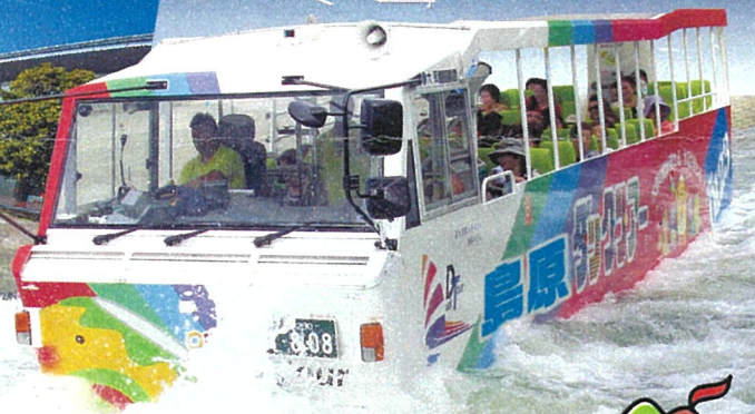
島原復興アリーナ