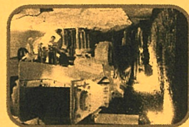
↑ドラムカッター ↓電気機関車