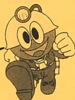
石炭館キャラクター クロベくん

大きなハンドルを握って運転士の気分になれるよ。 路線バスの運転席に座ってのアナウンスや車両点検 などが体験できちゃうんだ。