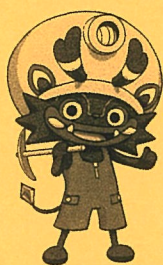
大牟田市公式キャラクター 「ジャー坊」