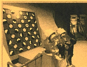
光のエネルギーで円盤を回そう