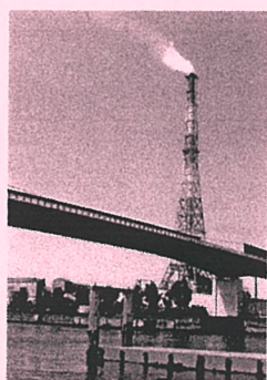
昨年の特選作品 タイトル：産業発展の架け橋