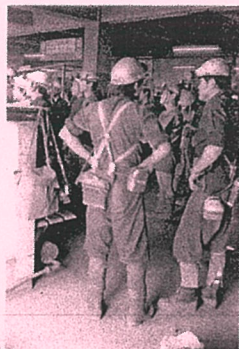
昨年の思い出のスナップ写真より (昭和 56 年頃の四山鉱、線込み場)