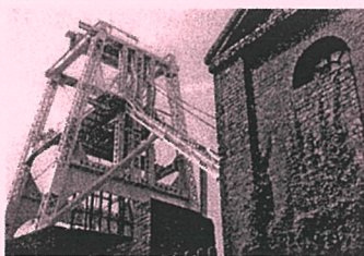
昨年の石炭館 館長賞作品 タイトル：歴史てき建物