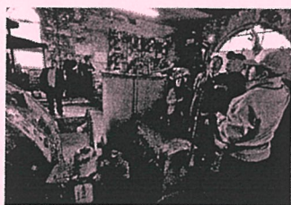
昨年の準グランプリ作品 タイトル：百年歴史の印象