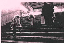
(昭和 50 年 12 月大牟田駅袴線橋)