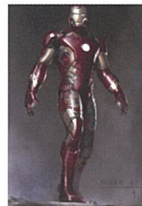
アイアンマン アーマー

スーパーヒーローたちの戦う姿と日常の姿を、彼らが主に活躍する三つのフィールド「コスミック&ミスティック」「グローバル」「ローカル」から衣裳や映像で紹介しします。