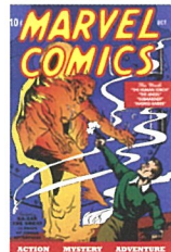
「マーベル・コミックス」#1(1939年)

マーベルはコミックブック出版のブームが興隆した1930年代に始まって以降、現在活躍するスーパーヒーローたちを続々と生み出してきました。ここではマーベルの歴史を振り返ります。