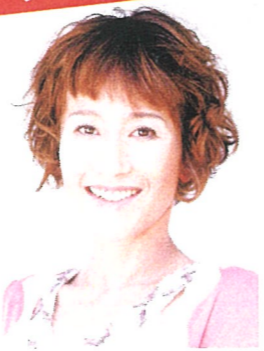
松野明美 公式サイト http://www.matsunoakemi.net

元オリンピックランナー・ タレント・熊本県議会議員 まつ の あけみ 松野明美さん