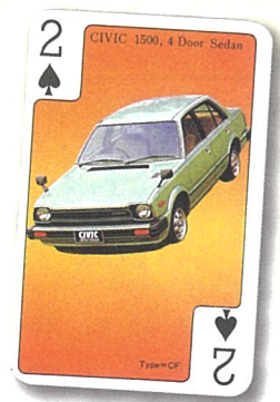
▲HONDA (パン) トランプ

そこで秋の企画展では、当館所蔵の資料の中から鉄道や車、さらには飛行機や船など「乗物」を中心としたカルタやトランプを展示公開します。