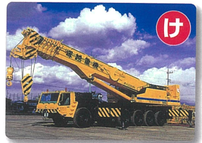
▲はたらくくるまかるた

また、九州鉄道記念館のご協力を得て、観光列車の紹介パネルや関連資料の展示のほか、関連事業を実施します。