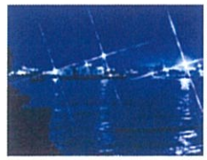
2017 グランプリ作品 「静かな三池港」撮影/山下 雄