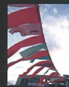
野外のれんアート

主催:炭都国際交流芸術祭in大牟田実行委員会 後援:大牟田市/大牟田市教育委員会/大牟田美術協会/大牟田音楽家協会 音響協力:Gスタッフ Support by Kazato