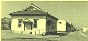
旧長崎税関三池税関支署