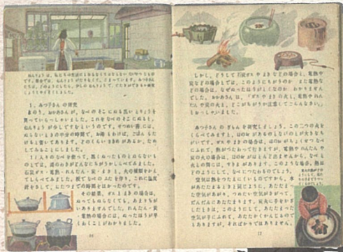
【昭和24年】 第4学年小学生の科学