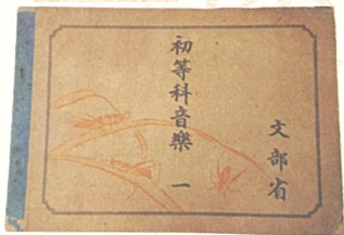
▲初等科音楽【昭和17年】