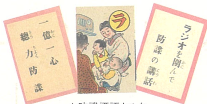
▲防諜標語カルタ【昭和16年】