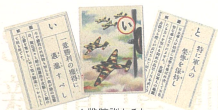
▲戦陣訓かるた【昭和16年】

■日本では1872(明治5)年に「学制」が公布され近代学校教育制度が整備されるとともに、学校教科用の図書として「教科書」が登場します。当初の教科書は自由発行・自由採択でしたが、自由民権運動が高まると民権思想を排除するため、政府は1886(同19)年にこれを検定制に改めます。以降、政治権力が教科書に介入し始め、1890(同23)年の「教育勅語」発布により教育の基本方針が規定され、1903(同36)年には小学校教科書を国定制に切り替えます。 ■国定制のもとでは、政府の思い通りに教科書は書き換えられるようになり、歴史上の人物や事件の評価などが政治的圧力により改変され、子どもたちの知的好奇心や探究心を阻害していました。 ■今回の平和展では、当館が所蔵する戦時資料の中から主に戦前から戦後にかけての教科書やカルタを展示し、その変遷を通して、戦争と平和について考えます。