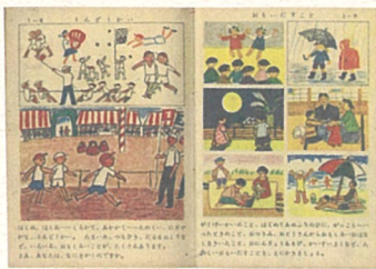
▲小学图画工作【昭和23年】