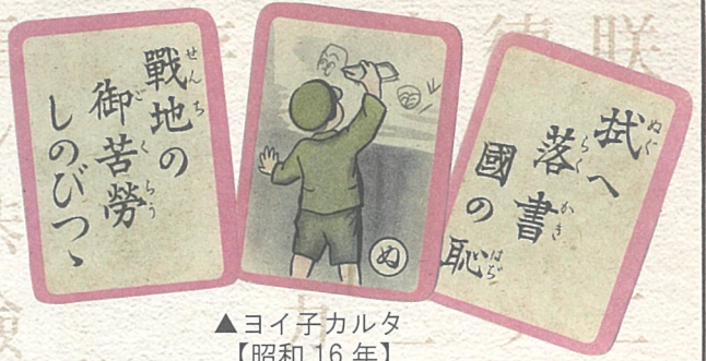
▲ヨイ子カルタ 【昭和16年】