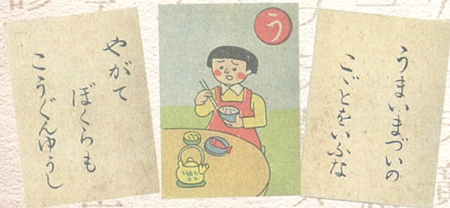
▲国家総動員 よくさんかるた 【昭和16年】