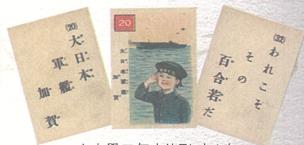
▲小学二年オサラヒカルタ 讀方修身【昭和12年】