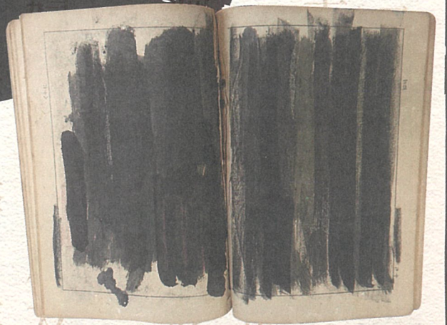
▲初等科国語(四)〈墨塗り教科書〉 【昭和17年】