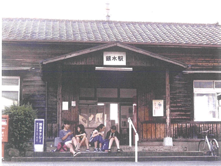
第20回 石炭館館長賞「佳よし」

※近代化産業遺産をはじめ、大牟田・荒尾の地域ならではの写真を募集。 おおむね5年以内に撮影されたもの。