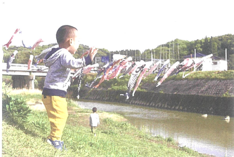
第20回 特選「見ゆい」