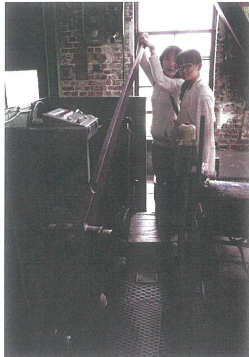
第20回 入賞「初めての体験」