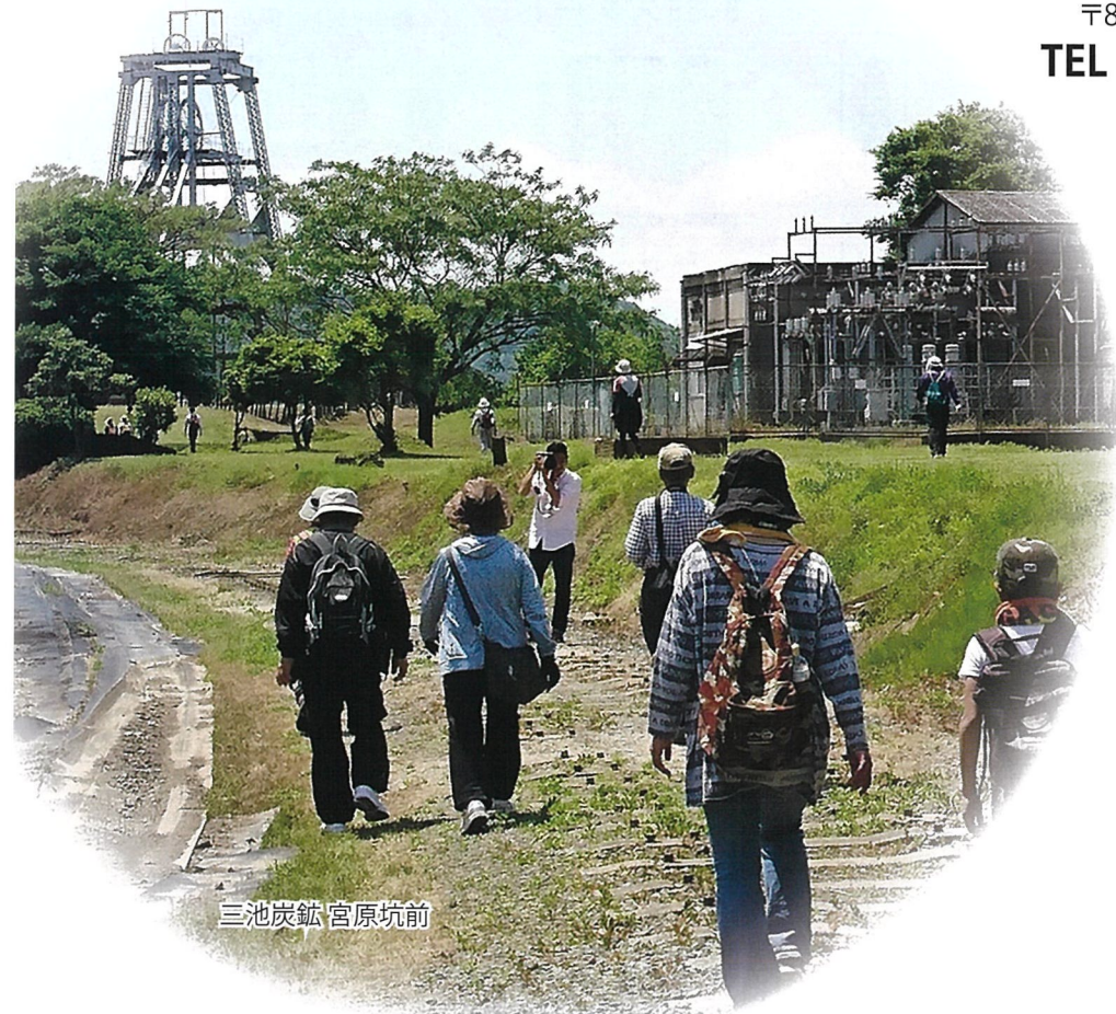
三池炭鉱 宮原坑前