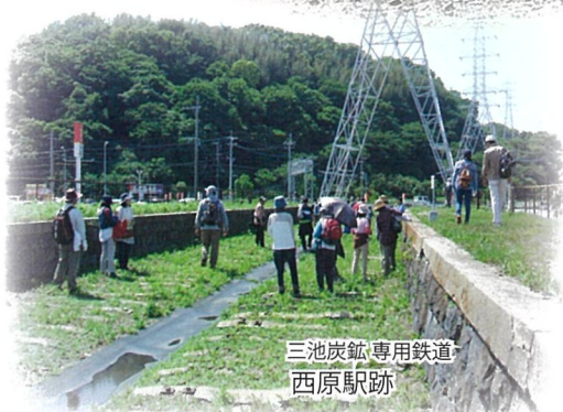
三池炭鉱 専用鉄道 西原駅跡