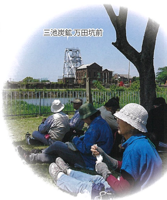
三池炭鉱 万田坑前