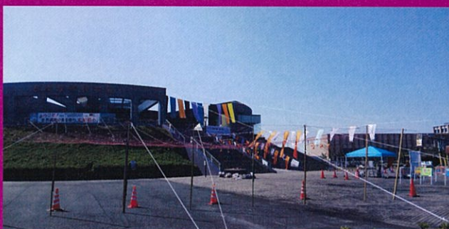
大牟田市石炭産業科学館