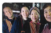
シンチャオ ヴェトナム 民族楽器