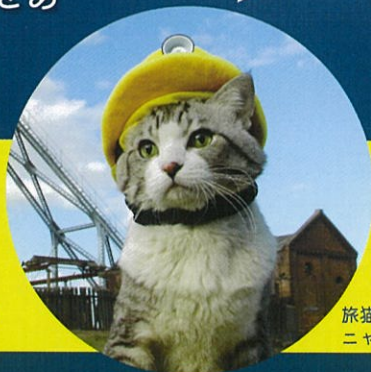
旅猫 ニャン吉くん