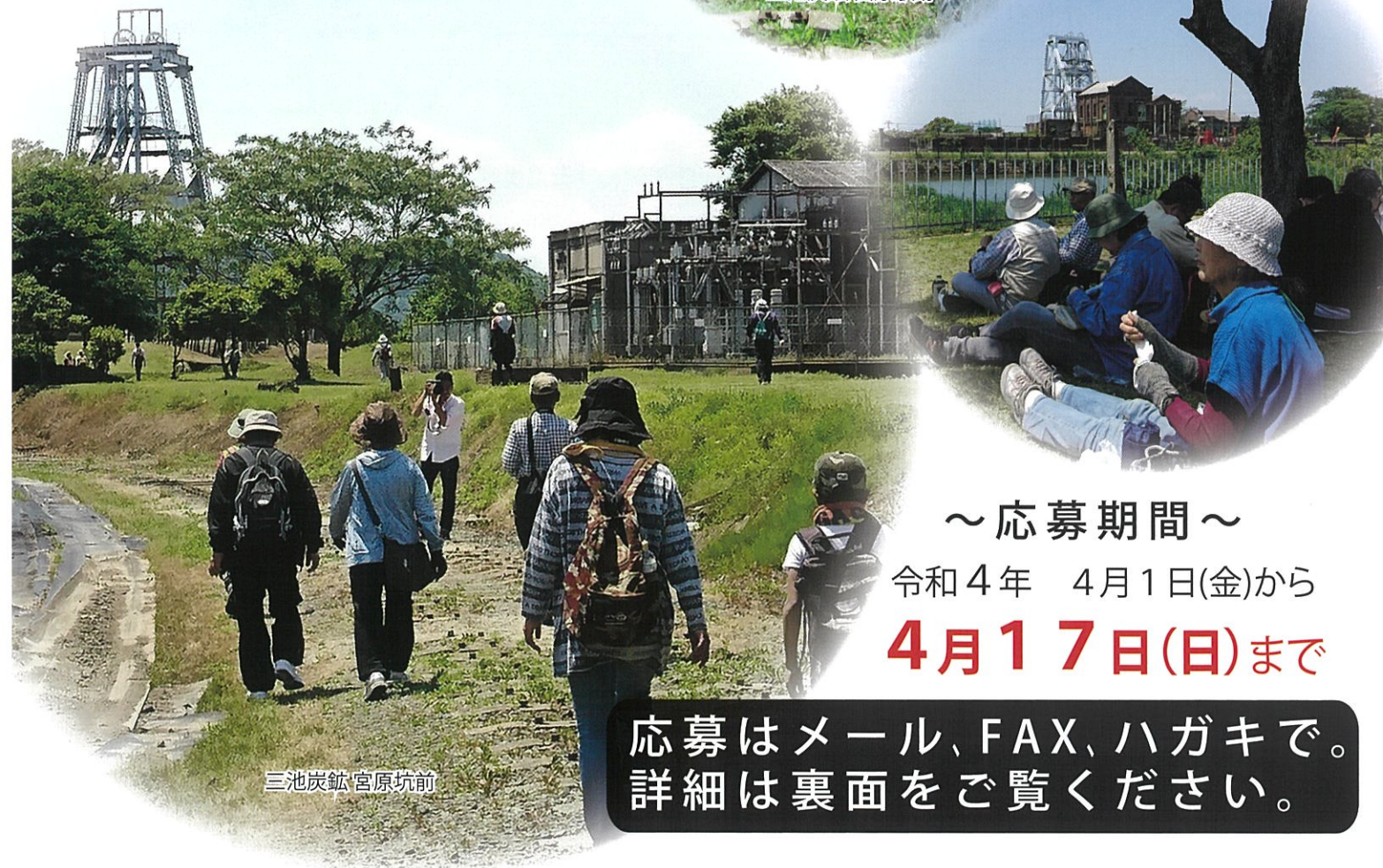
三池炭鉱 宮原坑前