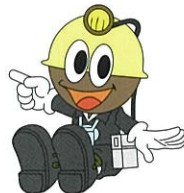
石炭館キャラクター クロベエくん