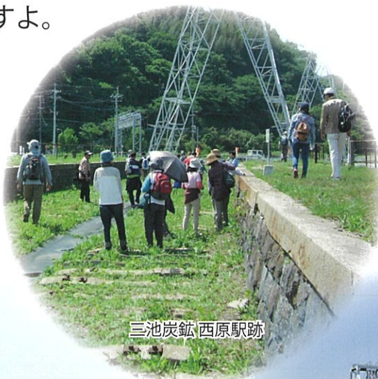
三池炭鉱 西原駅跡