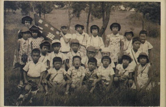
「銀水社宅子ども会キャンプ」