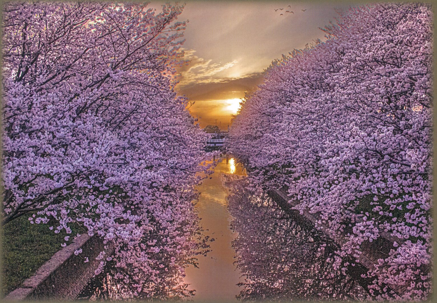
令和4年度 グランプリ作品「夕陽の桜」