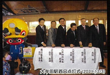
大牟田駅西口点灯式(2021.12/3)