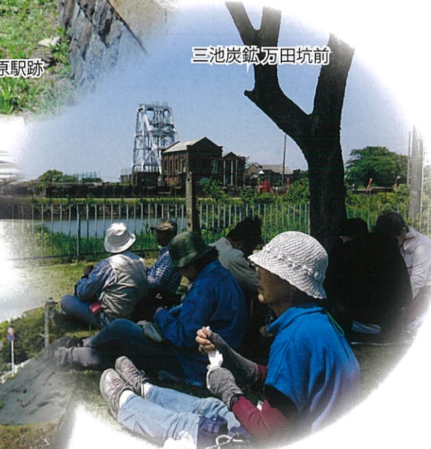
三池炭鉱万田坑前