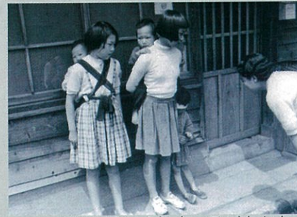
子守を手伝う社宅の子どもたち (三池労組資料より)