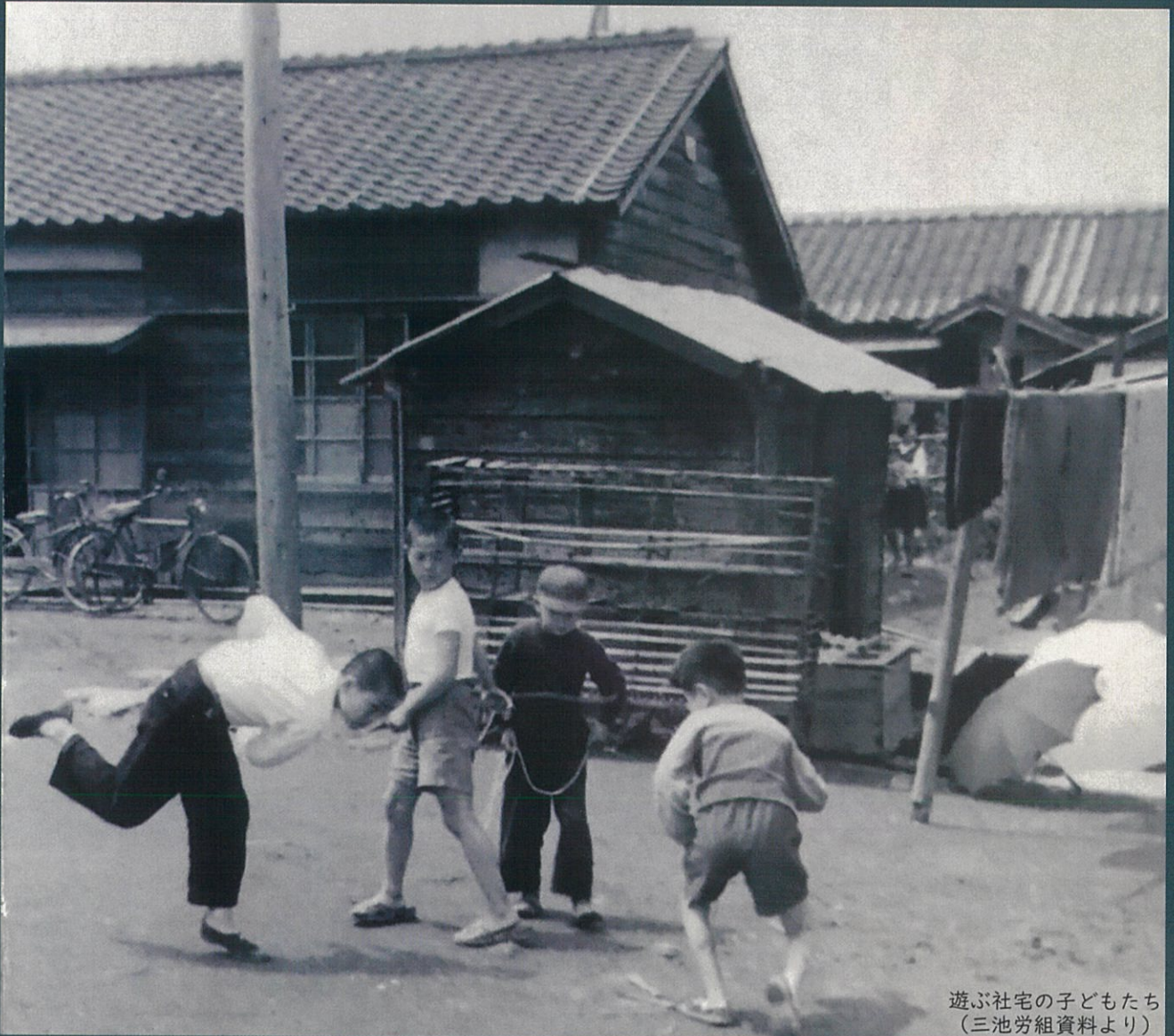
遊ぶ社宅の子どもたち