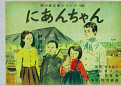
紙芝居 「にあんちゃん」