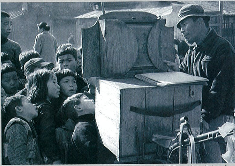
街頭紙芝居

三池炭鉱があった大牟田・荒尾の炭都には、炭鉱や関連産業で働く多くの労働者や家族が集まり、周辺地域や他の都市とは異なる独特の生活や文化が生まれました。