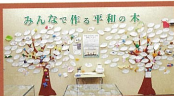
▲2022年展示「みんなで作る平和の木」

展示前に用意された花びら型カードに、平和へのメッセージを書いて、たくさんのひまわりを咲かせませんか? ※詳細は当館HPなどでご確認ください。