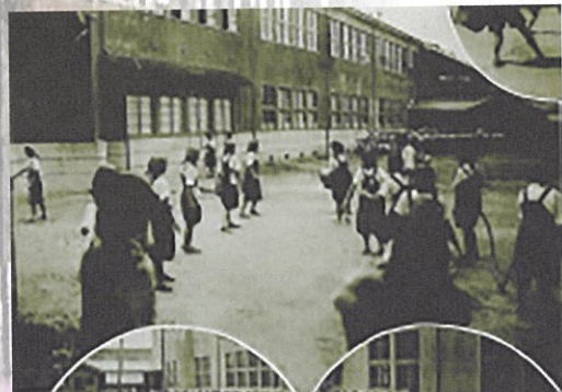
▲大牟田市立高等女学校卒業アルバムの一部(昭和18年) ▲上面像をCGにてカラー復元したもの

昭和12年(1937)に勃発した日中戦争を契機に、人々のくらしは戦争に勝つことを優先したものと変化しました。