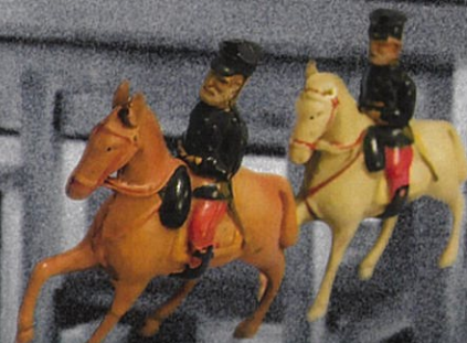
▲乃木將軍馬上人形