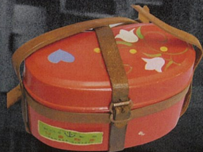
▲子ども飯盒 (はんごう)