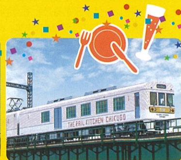
THE RAIL KITCHEN CHIKUGO